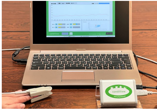
ヒトの活動性のバロメーター